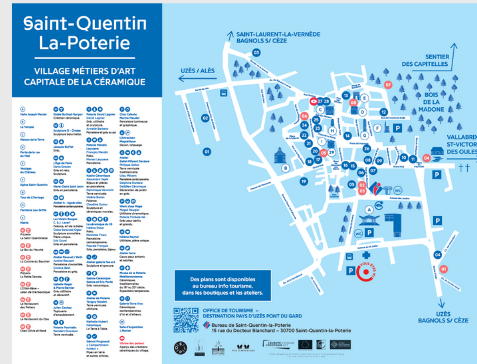
Panneaux parkings (4)