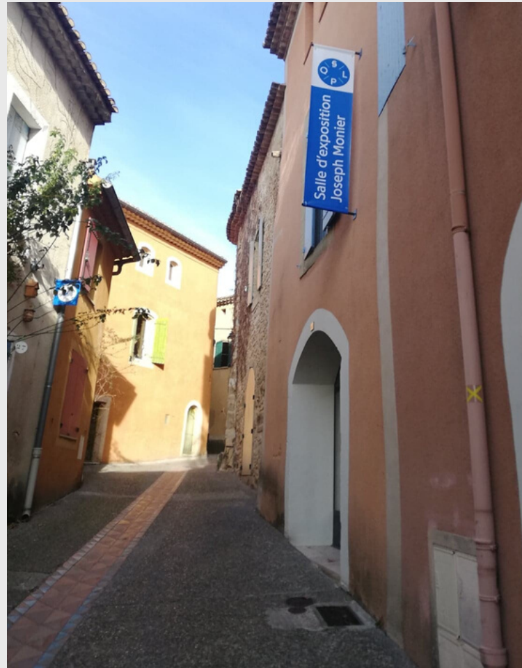
Potences devant chaque atelier et lieux culturels