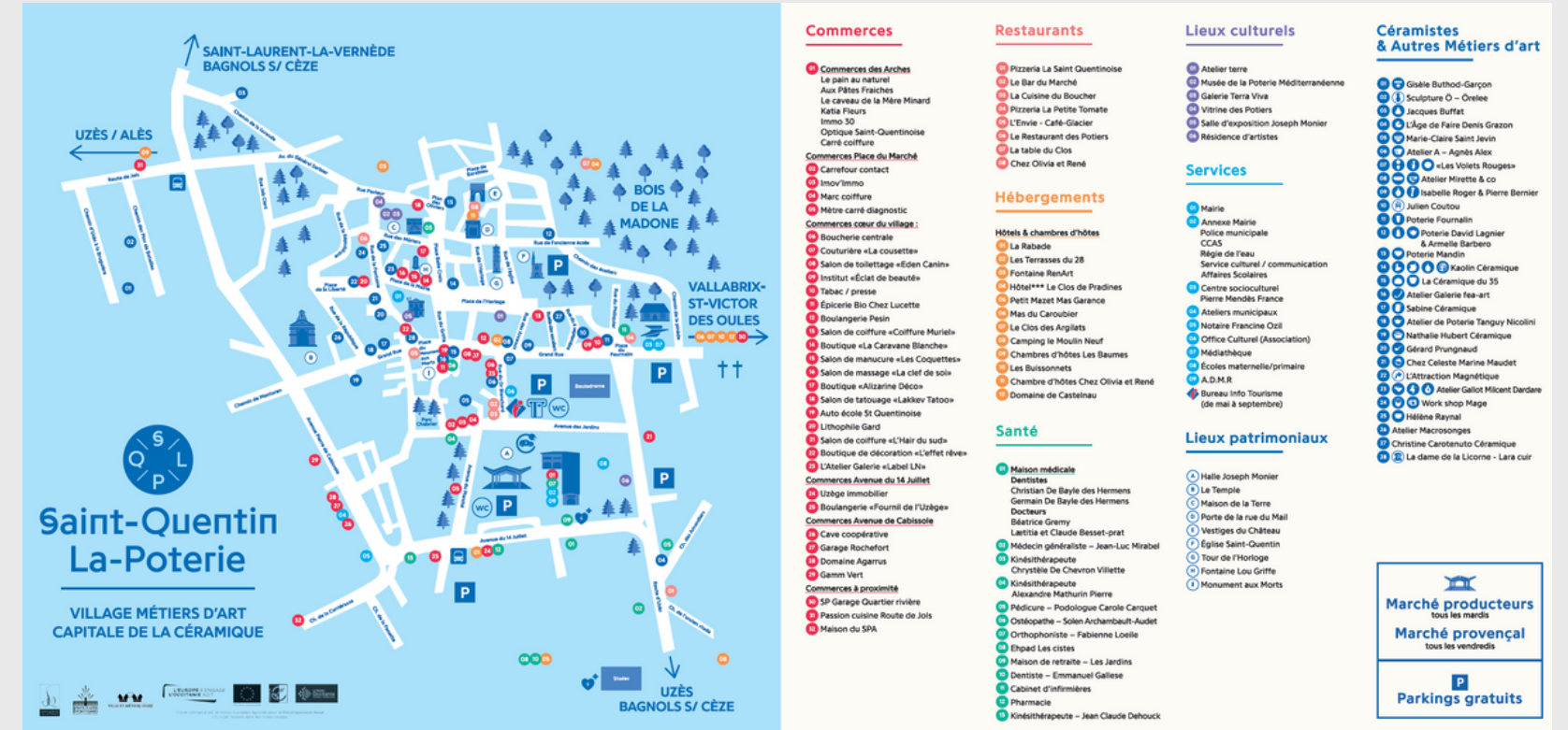
Panneau place du marché