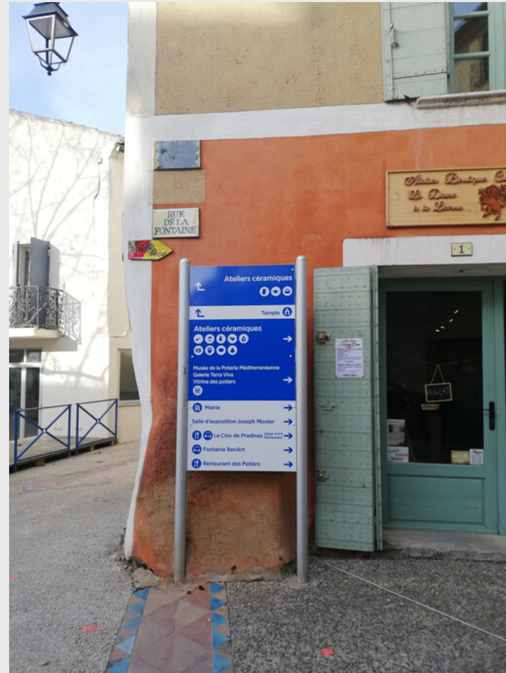
Signalétique dans le village