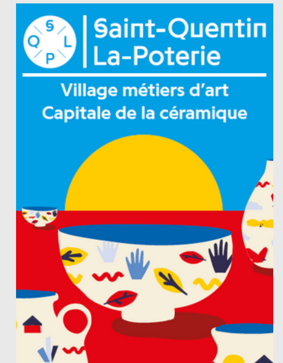
Panneaux entrées village