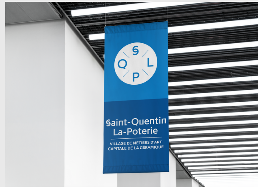
Calicots avenue du 14 juillet (à refaire par MediaSun)